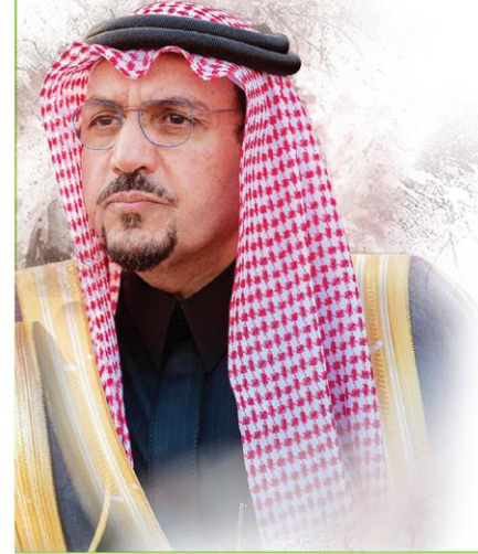
صاحب السمو الملكي الأمير الدكتور

فيصل بن مشعل بن سعود بن عبد العزيز آل سعود